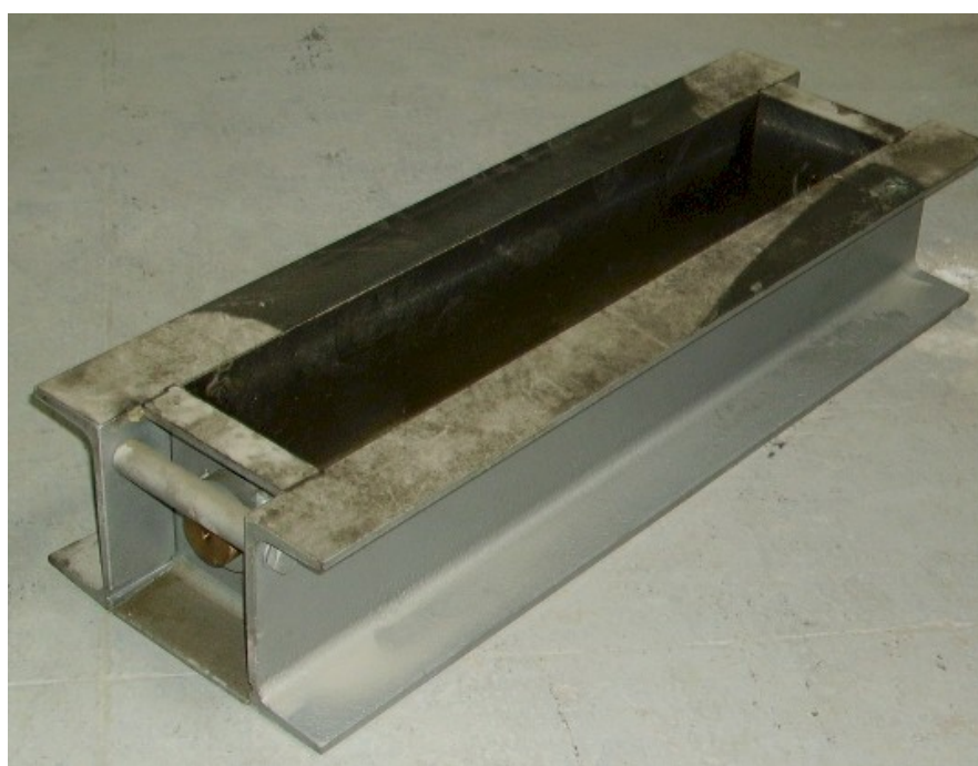
L'universale impostata per le prove di flessione e la cassaforma in acciaio per provini prismatici