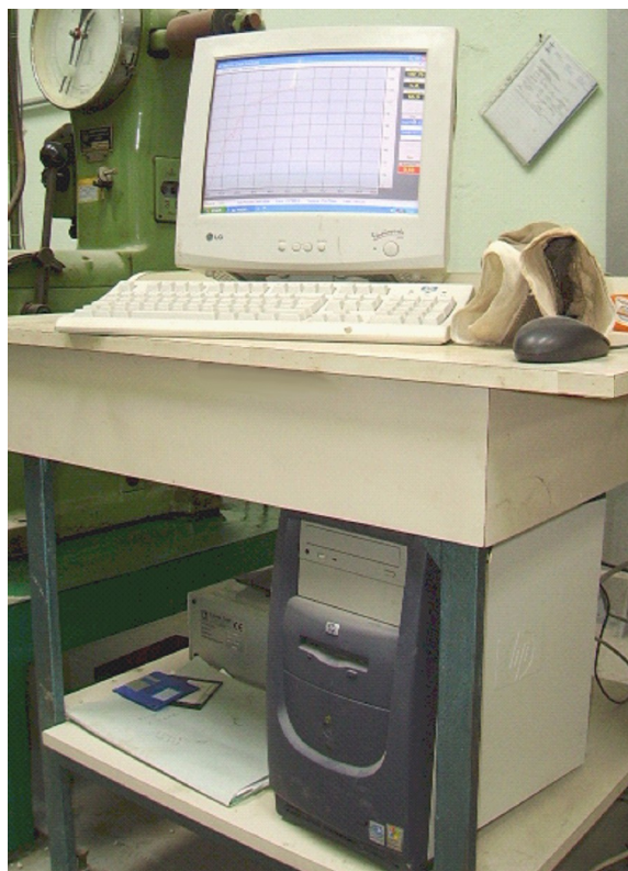
LOSENHAUSENWERK UPH10 100 KN con acquirente LONOS TEST